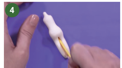
4 Realizar el cuello y cortar las piernas. Redondearlas bien quitando las marcas del corte.