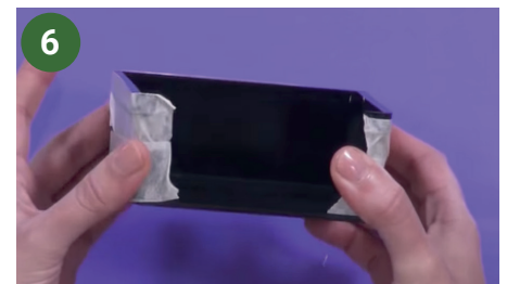
6 Forrar con cinta de papel el porta taco de papel.