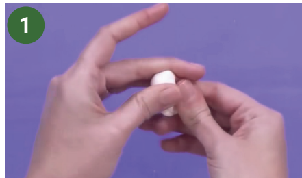
1 Teñir la porcelana fría con color piel claro.