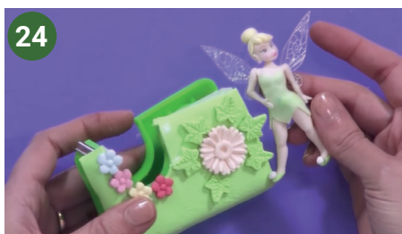
24 Decorar con flores y para colocar el hada realizar una base.