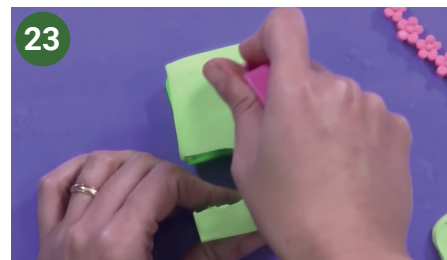
23 Texturar con un cepillo de cerda dura.