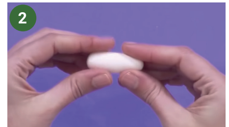
2 Para el cuerpo comenzar con un rollito.