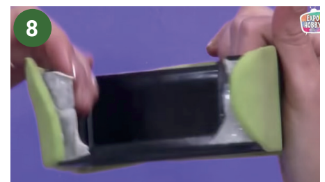
8 Forrar con porcelana fría color verde.