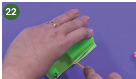
22 Retirar el excedente de masa.