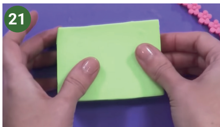
21 Forrar con porcelana fría color verde.