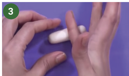
3 Marcar la cintura y las piernas.