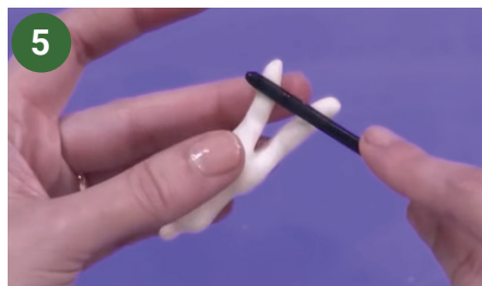
5 Con la cola de un pincel marcar la parte de atrás de las rodillas y el tobillo.