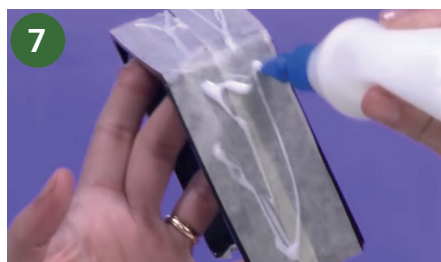
7 Colocar cola vinílica.